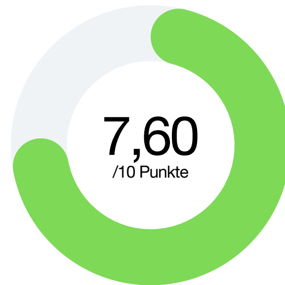
Faktor 1 Kundenbindungs- maßnahmen