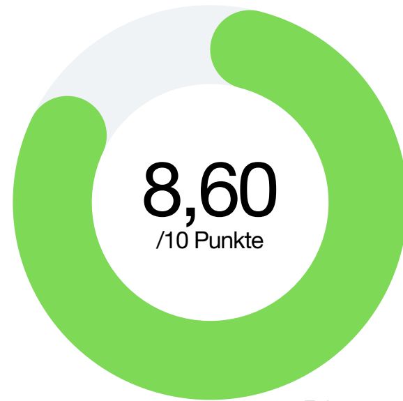
Faktor 1 Transparenz