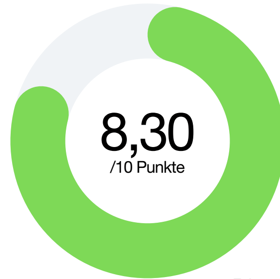
Faktor 1 Kommunikation