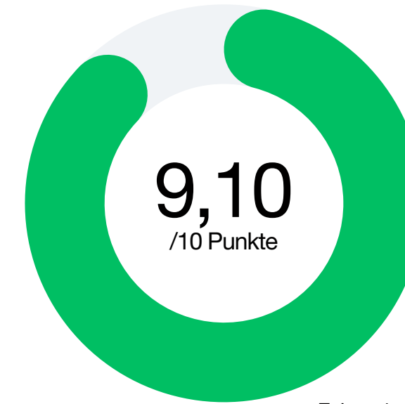
Faktor 1 Erreichbarkeit