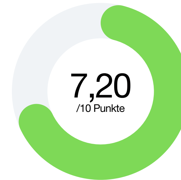
Faktor 1 Digitalisierung