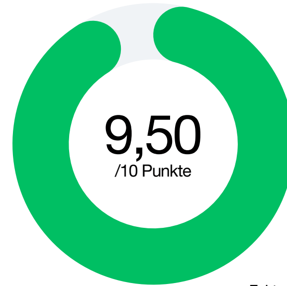
Faktor 1 Kundenfeedback